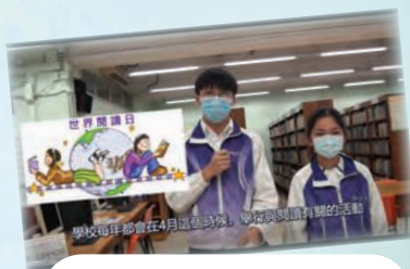
閱讀週啟動日司儀 為同學們介紹各項活動

為了響應4月23日「世界閱讀日」，我們舉行了為期五天的閱讀週，希望藉著各項活動推廣閱讀文化，培養和提升同學們對閱讀的興趣。我們今年以「不只七十二行」為閱讀週的主題。目的是透過不同書籍的內容分享，和同學們探討生涯規劃的重要性以及介紹一些新興的行業，希望同學能為個人未來的升學及就業作準備，好好裝備自己做好人生規劃。我們為每位同學準備了閱讀小冊子，並有展板介紹和書籍展覽，除此之外，圖書館和中文科更合作舉辦「硬筆書法比賽」，同學們都積極參加並提交出優良的作品。