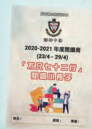
「不只七十二行」 閱讀小冊子