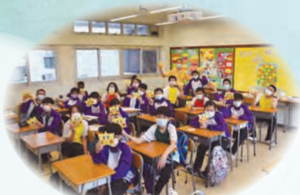
中一同學們製作感謝卡