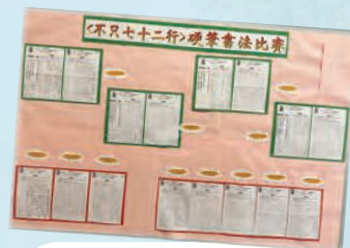
硬筆書法比賽作品 於壁報版上展示