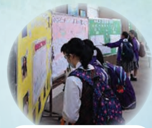
同學們積極參與 有獎問答遊戲