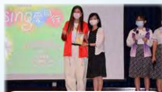
黃校長為嘉賓送上感謝狀