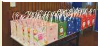
校長贈送小禮物予中六同學