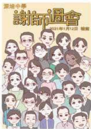
中六同學設計的謝師周會程序表封面

中六級同學為了答謝深培師長多年來的教導及關懷，全級同學特意共同預備一個周會，並透過直播系統令全校老師同時間都能觀賞。部份中六同學負責設計程序表及感謝卡，並把感謝卡送給師長；其他同學則透過各類表演環節，如舞蹈、話劇、唱歌及演說，以表達對校長、老師、工友等職員的謝意，希望令師長們感到他們真摯的心意！