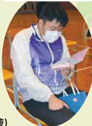
中六同學感受一絲絲的暖意

中六同學即將面對香港中學文憑考試，我們特為中六同學舉辦文憑試誓師大會，為中六同學打下強心針。過程中校長向各位同學作出勉勵，並贈送親手寫的鼓勵卡及小禮物，以鼓勵中六同學。老師們亦分享自己公開試應試經歷及拍攝加油影片，而就讀大學的校友亦分享備試及升學心得，希望激勵中六同學努力溫習。