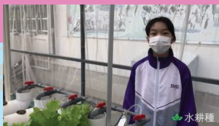
中一同學向小學母校師長介紹學校環境

今年因為疫情關係，我們不能如以往般帶領中一的同學回小學母校探訪校長和老師，但我們改為讓同學們拍攝及錄製感謝短片和寫信，郵寄給小學母校的師長，希望在聖誕節的前夕讓小學母校的師長感到一份暖暖而溫馨的心意，以表達他們對小學師長的感謝和思念。