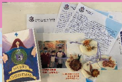
中一同學寫給小學母校師長的信及親手製作的禮物